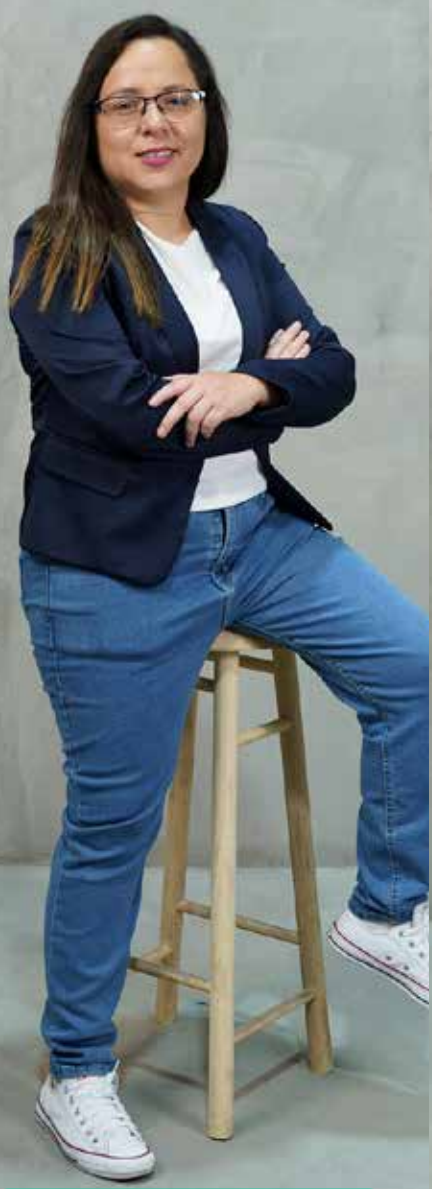
Yarazeth Cilia Subdirección Académica