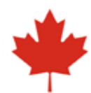
Dr. Gabor Maté

Creador del enfoque terapéutico "Compassionate Inquiry"