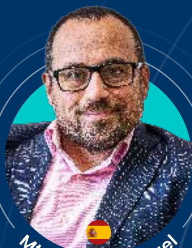
Mtro. Miguel Ángel Díaz Escoto